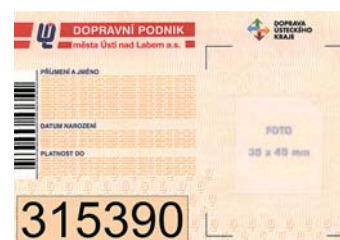
Vzor žákovské průkazky od 10 do 15 let – DPmÚL a.s.

DPmÚL a.s., časové kupóny však už nebudou nést číslo tohoto průkazu, nebo si zřídí Žákovský průkaz do 15 let (podmínky vystavení jsou stejné jako u studentů). Cestující, kteří mají zakoupenou jízdenku, která má vyznačenou platnost i po 10. prosinci 2017 se nemusejí obávat, jíz-