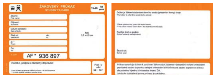
Vzor žákovské průkazky od 10 do 15 let.

za ověření nároku dopravcem je 60,- Kč. Dítě ve věku 10 – 15 let může k prokázání věku předkládat i nadále platný průkaz