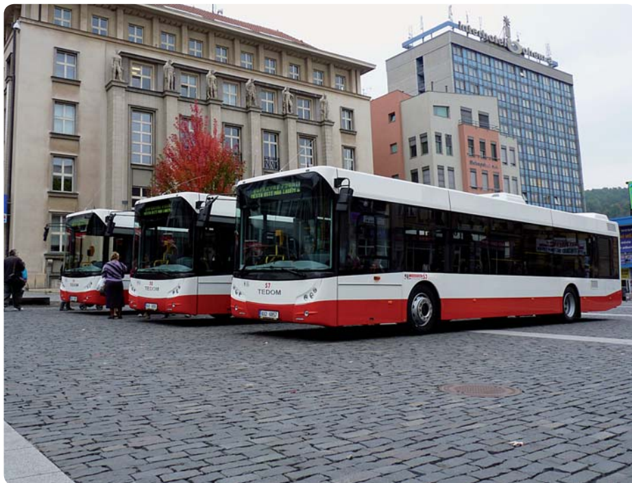
Slavnostní představení nových autobusů TEDOM C12D na Mírovém náměstí.

Celková cena sedmi nových autobusů činila 39,5 milionů korun. „Na pořízení autobusů, které Dopravní podnik pořídil z vlastních zdrojů, jsme obdrželi dotaci od ministerstva dopravy ve výši 5 150 000 korun,“ upřesnil náměstek pro ekonomii a rozvoj dopravy Vladimír Buldra.