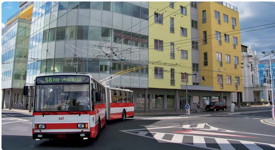
Trolejbus evidenčního čísla 567 v první den provozu s cestujícími v Ústí nad Labem.