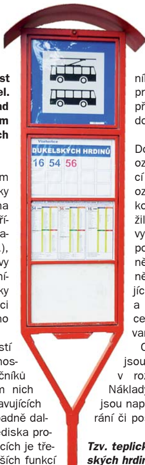
Tzv. teplický označník v zastávce Dukelských hrdinů.

Dopravní podnik města Ústí nad Labem a.s. má v současnosti ve správě celkem 480 označníků různých typů. Prostřednictvím nich informuje cestující o zastavujících linkách, jízdních řádech a případně dalších provozních údajích. Z hlediska provozu na pozemních komunikacích je třeba zmínit jednu z nejdůležitějších funkcí