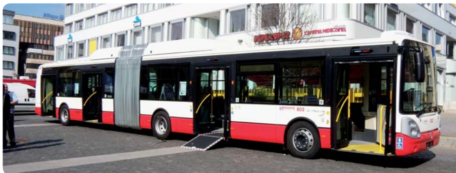
Autobus Iveco Citelis 18m si zájemci mohli prohlédnout už 21. 3. 2012 na ústeckém Mírovém náměstí.

VOZOVÝ PARK – Posilu v podobě nového autobusu Irisbus Iveco Citelis 18m s pohonem na stlačený zemní plyn (CNG), přivítal v pondělí 19. března 2011 vozový park autobusů Dopravního podniku města Ústí nad Labem a.s.