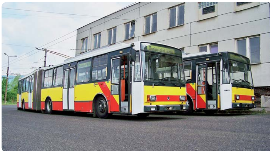
Dva hradecké trolejbusy ve všebořické vozovně krátce po svém příjezdu.

OBNOVA – V rámci postupné obnovy vozového parku zakoupil Dopravní podnik města Ústí nad Labem další dva trolejbusy. Jde o vozy, které donedávna jezdily v Hradci Králové.