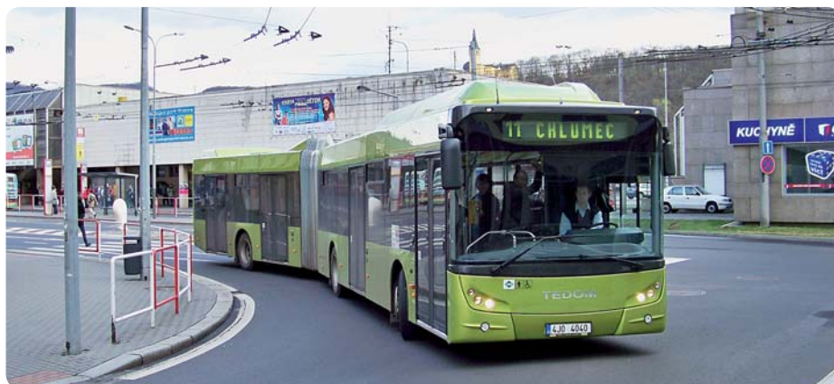
Zelený Tedom C18G jezdil v Ústí nad Labem od 4. do 28. dubna 2011.

Již v červnu loňského roku ale předložil na Státní fond životního prostředí ČR žádost o finanční podporu projektu „Ekologizace autobusové dopravy v Ústí nad Labem“. V rámci projektu žádá o přibližně padesáti milionovou dotaci na výstavbu plnicí stanice CNG a příspěvek